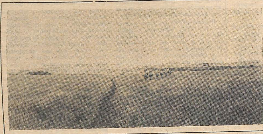
На снимках: вверху — кальдера Узон, внизу — озеро в урочище Синий дол.

Весело отметили 30-летний юбилей Володи Усени. Был даже именинный пирог, испеченный на костре. Вообще, этому Усене везет — он всегда умудряется «рож-