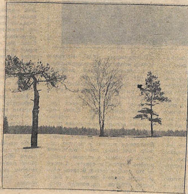
Народная фотостудия «Образ», включившись в подготовку к Всесоюзному смотру самодеятельного художественного творчества, посвященному 40-летию Победы в Великой Отечественной войне, организует фотоконкурс «Земля — наш дом». Его задачей является отражение средствами художественной фотографии образа жизни советского человека, показ исторических собы-